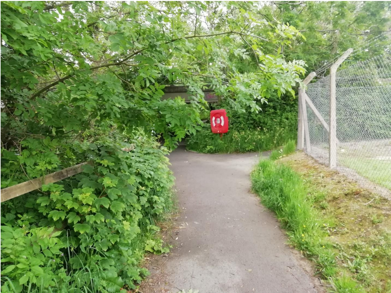
Ffigur 9: Llwybr Rheidol Mehefin 2021: