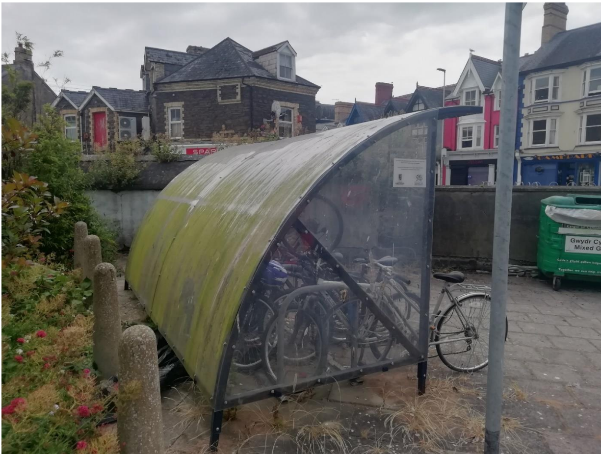
Ffigur 18: Stryd y Popty, Rhesel Feiciau a Phwmp Beiciau