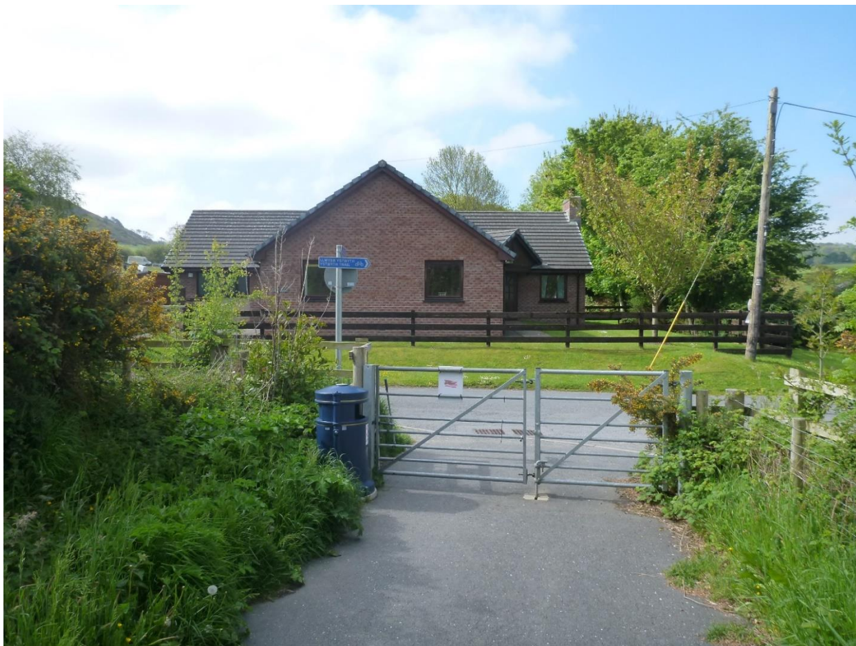
Ffigur 4: Yr un lleoliad Gorffennaf 2021: