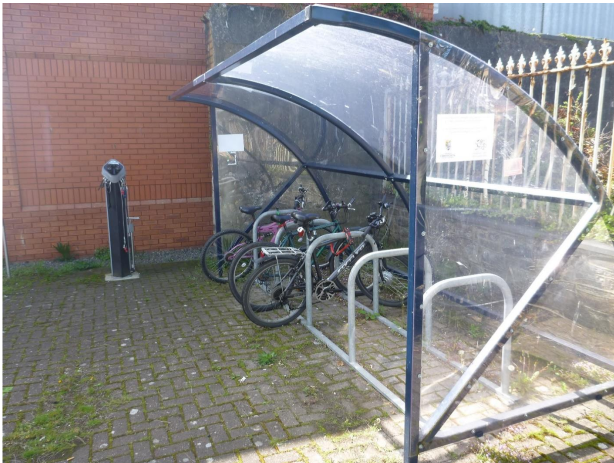
Ffigur 14: Mehefin 2020: