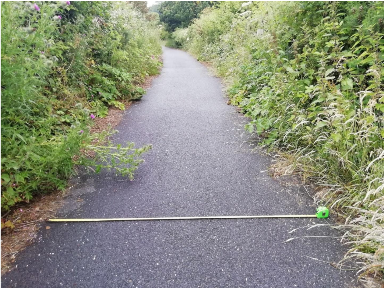
Ffigur 6: Llwybr Ystwyth Gorffennaf 2021: